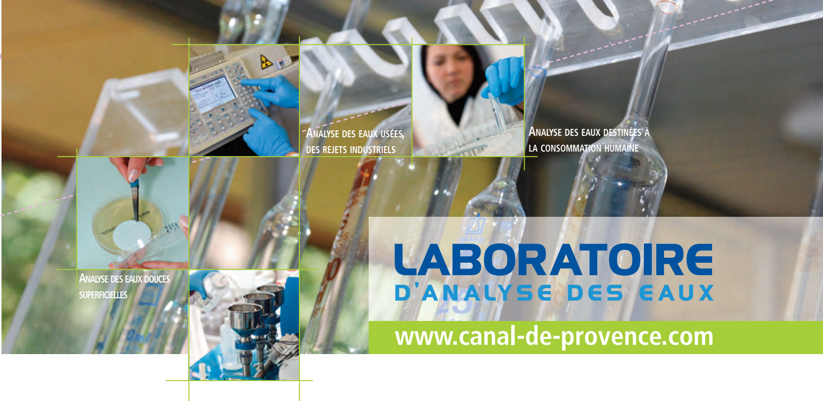
ANALYSE DES EAUX USÉES, DES REJETS INDUSTRIELS